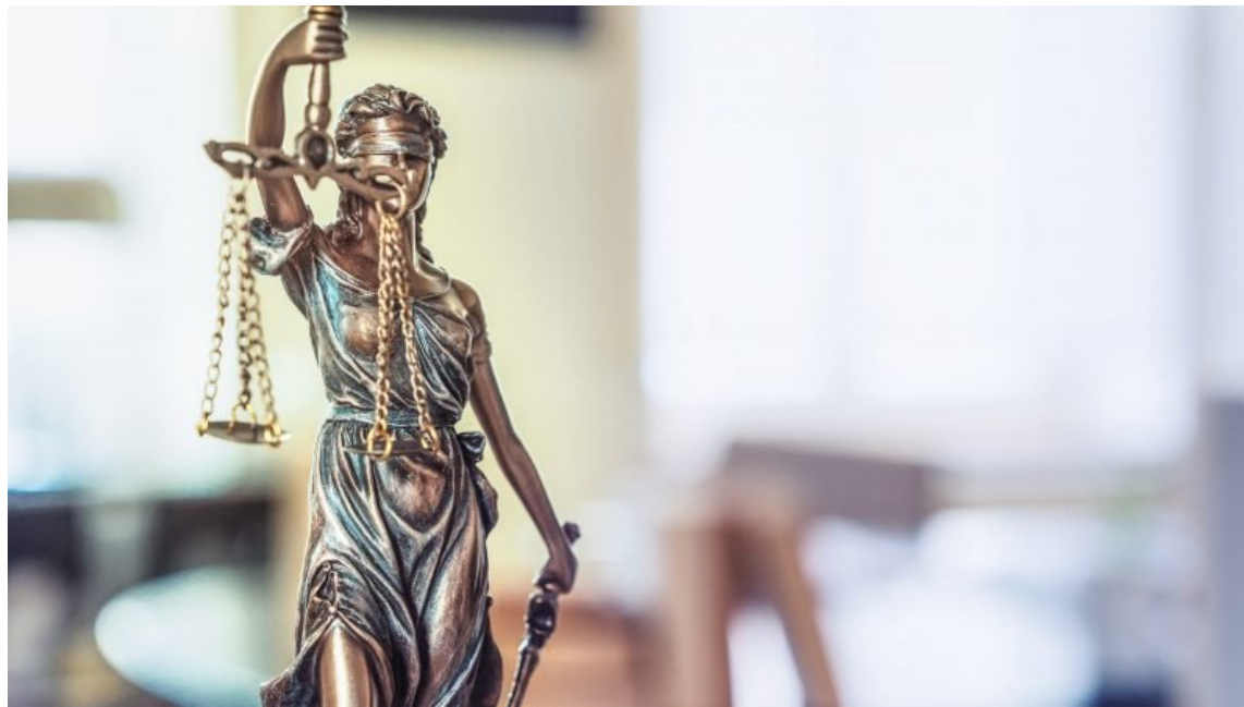
Die Justitia (Symbolbild).